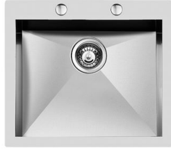
Fregadero Quadra 1216 050